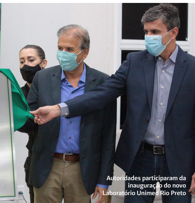
Autoridades participaram da inauguração do novo Laboratório Unimed Rio Preto