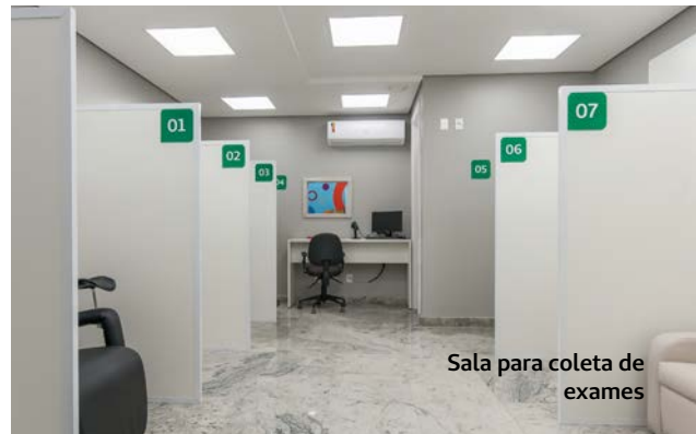
Sala para coleta de exames