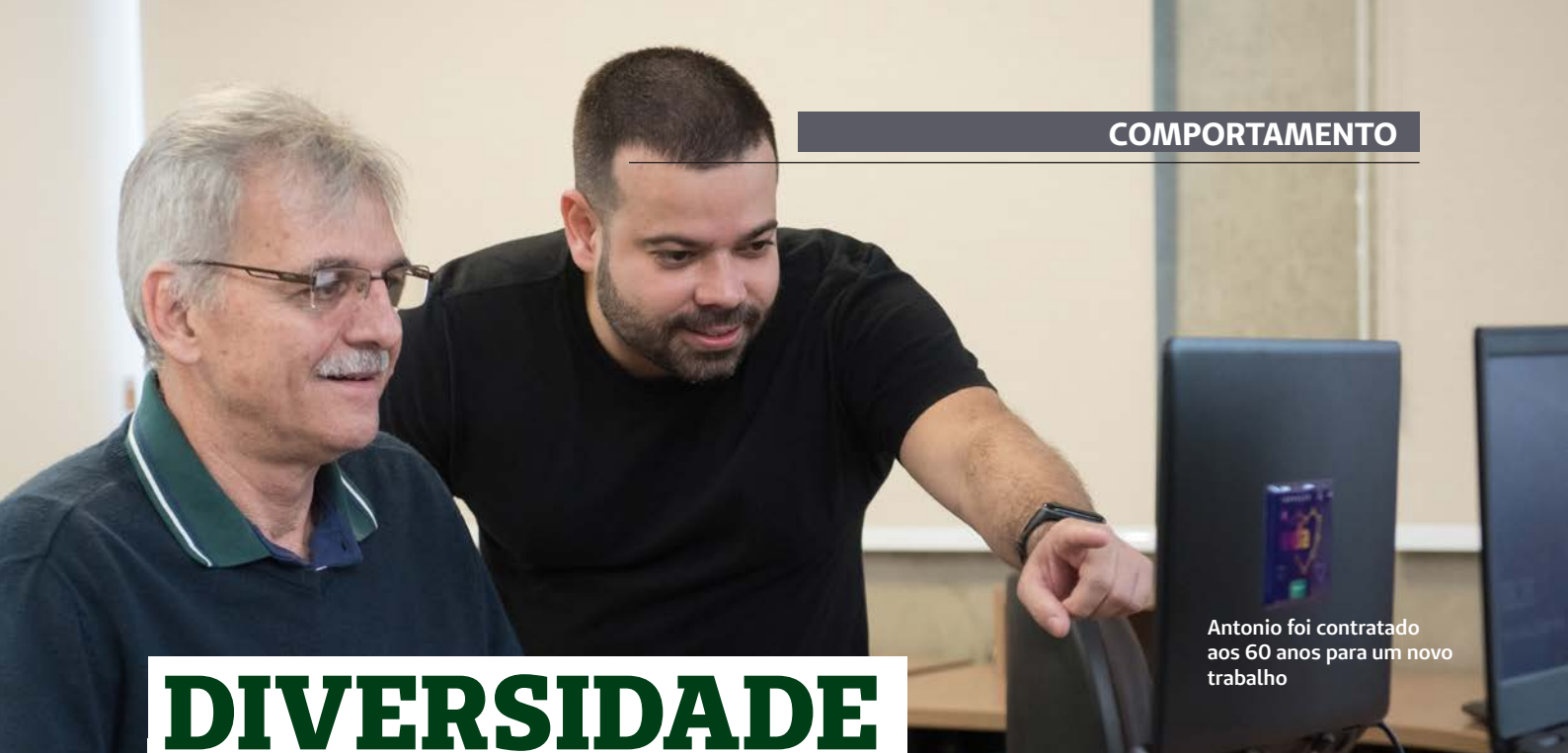
Antonio foi contratado aos 60 anos para um novo trabalho