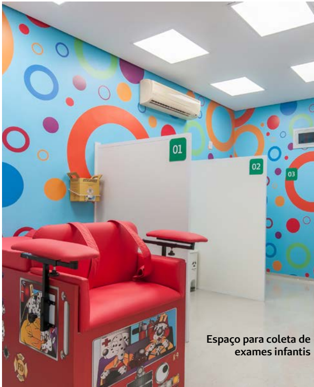
Espaço para coleta de exames infantis